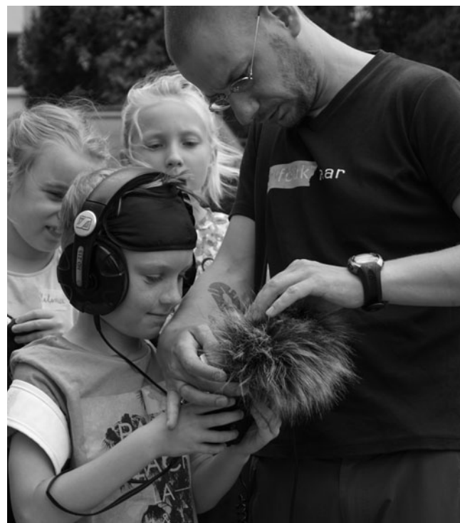
Sztuka Sześciu Zmysłów