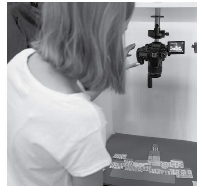
Warsztaty „Schodami do kultury”

Film dzięki atrakcyjnej, szczególnie dla młodych uczestników kultury, formie jest pomocny w realizacji podstawy programowej z wielu przedmiotów: języka polskiego, wiedzy o kulturze, historii i społeczeństwa, języków obcych, plastyki, muzyki, wychowania do życia w rodzinie, religii czy etyki. Najmłodszych wprowadza