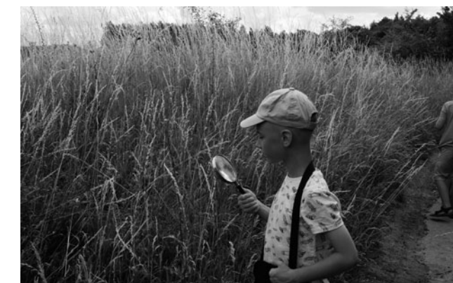
Sztuka Sześciu Zmysłów

Sztuka sześciu zmysłów była próbą pokazania dzieciom i młodzieży najnowszej sztuki, ale nie poprzez naśladowanie form a śledzenie artystycznych procesów. Zajęcia poprowadził zespół aktywnych artystów, którzy oprócz własnej twórczości poświęcają czas na dzielenie się swoim doświadczeniem poprzez prowadzenie warsztatów. Każda z osób reprezentuje odmienny nurt i język wypowiedzi – m.in. sztuka dźwiękowa, sztuka haptyczna, performans, obiekty, malarstwo. Uczestnicy warsztatów mogli stać się artystami,