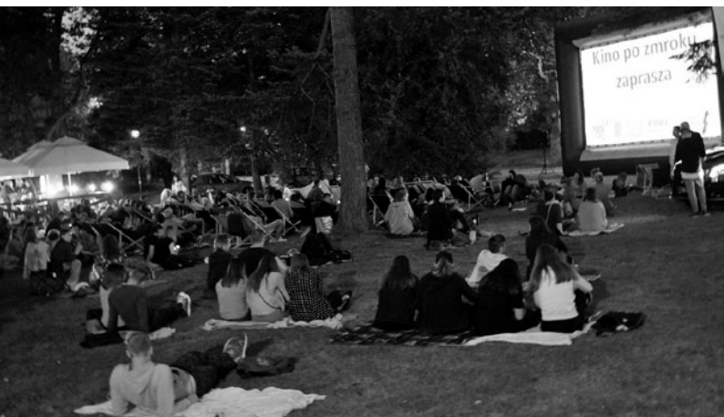
Kino po zmroku

Dobre kino w dobrej cenie. Seanse filmowe,