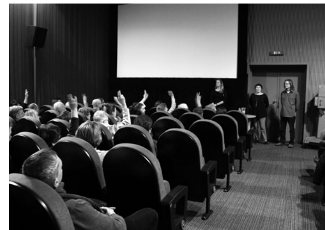
Walentynki RETRO filmowe

Festiwal Filmów Frapujący już na stałe wpisał się w kalendarz imprez filmowych Kina 60 krzesel. To weekend pełen krótkiego acz treściwego kina. W tym roku odbyła się już siódma edycja Festiwalu, która przez trzy dni, zgromadziła twórców, widzów na pokazach konkursowych i specjalnych. Z różnych stron Polski nadesłano 150 filmów, z których do Festiwalu zakwalifikowało się 26 tytułów. Oprócz pokazów filmów konkursowych Festiwalowi towarzyszyły wydarzenia: