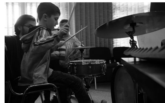
Warsztaty sztuki Karuzela

Przygotowane zostały z myślą o dzieciach w wieku od 6 do 9 (grupy przedszkolne 6 – latków, kl. I i III szkoły podstawowe). Zajęcia prowadzili znani artyści i edukatorzy. Program warsztatów dopasowany był do wieku dzieci i stanowi uzupełnienie przedszkolnej i szkolnej edukacji. Dzięki zabawie dzieci poznają tajniki wielu obszarów sztuki współczesnej. Spotkania pobudzają do swobodnej aktywności twórczej, rozwijają umiejętność pracy w grupie i samodzielności, dają możliwość rozwoju emocjonalnego, zdolności manualnych, koordynacji ruchowej, poczucia rytmu, pobudzają ciekawość i wspierają uzdolnienia.