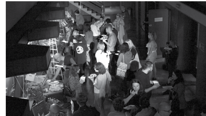
Walentynki RETRO filmowe

Jeden z najważniejszych festiwali kina dokumentalnego w Europie, nagrodzony przez Polski Instytut Sztuki Filmowej jako najważniejsze międzynarodowe wydarzenie filmowe w Polsce.