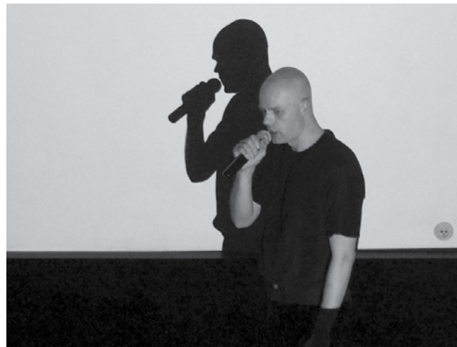
Koncerty Wojciecha Bąkowskiego