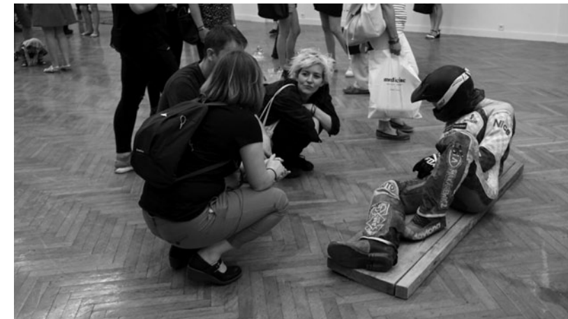
Żużel w sztuce